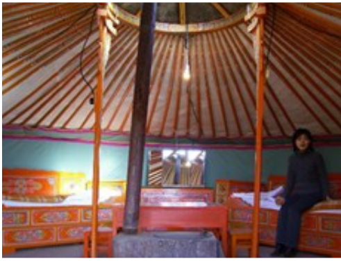
ゲル・ツーリストキャンプの例