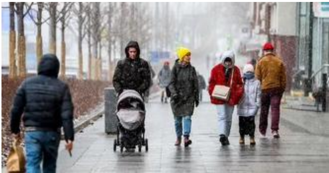
写真:モスクワ市内の様子

ただ、今年の秋にモスクワ市の郊外へドローンが飛来した事件があり、シェレメーチェヴォ空港が一時閉鎖されました。空港閉鎖はフライトの発着に遅延をもたらしましたが、数時間以内に解除されて、モスクワ空港はすぐ通常業務に戻りました。