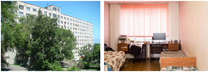
写真:(上)極東連邦大学全景 (下)学生寮と内部の部屋

メインキャンパスまで、バスで片道 40 分くらいです。入学手続きはメインキャンパスで行うので、一緒にルースキー島までいかなければなりません。しかし、留学生が授業を受けるのは中心部の旧校舎です。ですから、学生寮の周りに生活に必要なものは何でもあります。買い物をするスーパー、薬局、電気製品ショップ、銀行、印刷センター、それにファーストフードをはじめいろいろなレストランがあります。