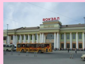
エカテリンブルグ駅

エカテリンブルグは帝政ロシア時代からの工業都市であり、ウラル地方の中心都市で人口143万人。モスクワからは1,419km離れており、時差も2時間ある(エカテリンブルグの方が早い)。航空機で約2時間30分、列車では27時間ほどかかる。