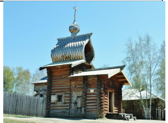
木造建築博物館タリツィ