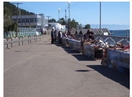
バイカル湖畔の魚市場

イルクーツク市内から車で約1時間にて到着する世界で一番深い湖。広さは琵琶湖の約50倍。「シベリアの真珠」と称されるようにその水は抜群の透明度を誇り、世界自然遺産にも指定されている。太古の昔より約350もの河川がこの湖に流れ込み、この湖独特の生態系を形作ってきた。バイカル湖アザラシやオームリ(サケの一種と言われる)など独自の生物も多い。周辺にはバイカル湖とその固有の生物を研究する博物館や、シベリア各地のロシア木造建築を集めた野外博物館「タリツィ」がある。