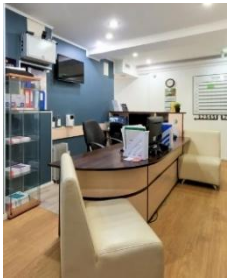
デルジャーヴィン・フロントデスク